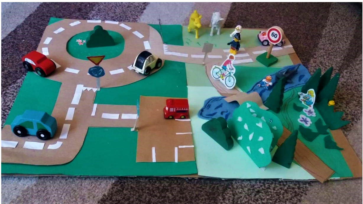
miejsce po zmianie

Stworzyłem makietę, która przedstawia zmianę po wyburzeniu ruin. Powstaną tereny zielone (łąki, drzewa) alejki rowerowe, staw, mostek widokowy, oraz parking dla wszystkich przyjezdnych, którzy chcą spędzić aktywnie czas.