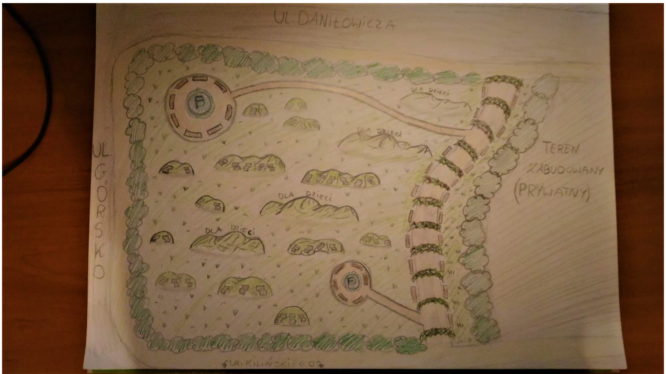
skwer po zmianie ul Górsko