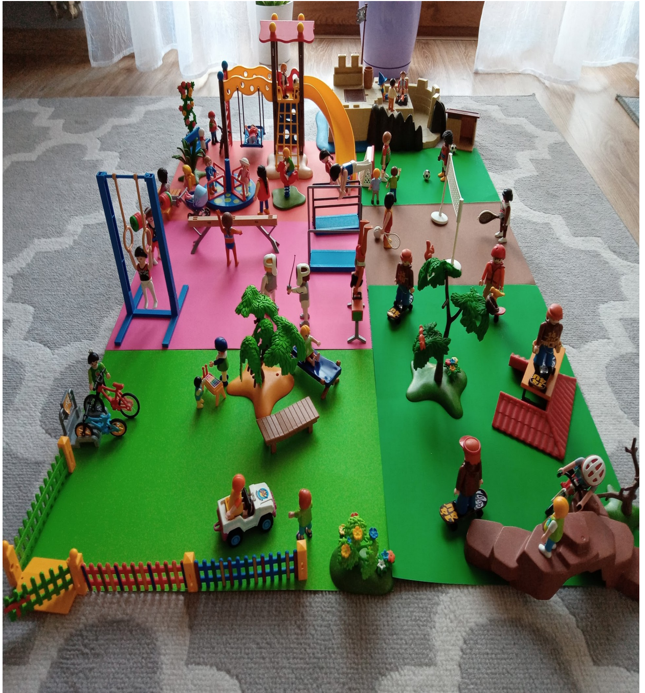
po zmianie - plac zabaw