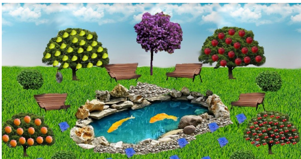
Ul.Kasztanowa po zmianie