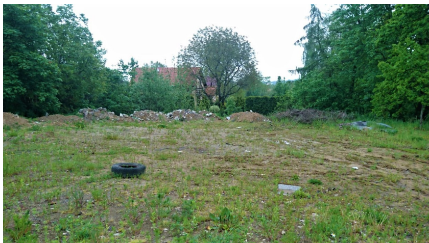
Ul. Kasztanowa przed zmianą

Projekt przedstawia kącik relaksu znajdujący się na ulicy Kasztanowej. Są tam drzewa, na których rosną rozmaite owoce. Znajdują się tam cztery ławki, i małe jezioro dzięki któremu, można się zrelaksować. Na jednym z drzew wisi opona, na której dzieci mogą się pohuścić.