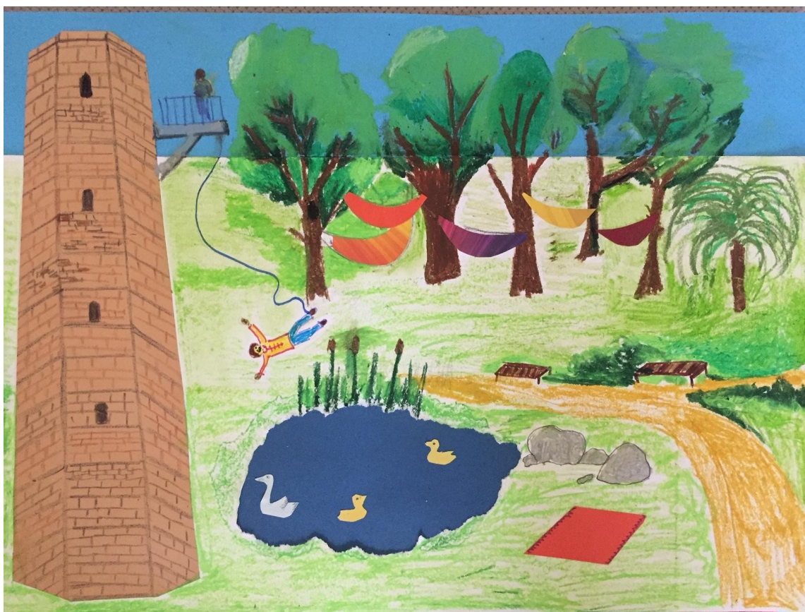
Stara Cegielnia i Park

Jest to rewitalizacja Starej Cegielni w Wieliczce. Zamiast sklepu i hotelu stworzyłbym piękny park z zabytkową wieżą. Zamieniłbym ten obszar na park, w którym można wypocząć na wygodnym hamaku, poczytać książkę siedząc na ławeczce przy stawie. Można by tam też było skoczyć z wieży na bungee. Byłaby to jedyna taka rozrywka w okolicy.