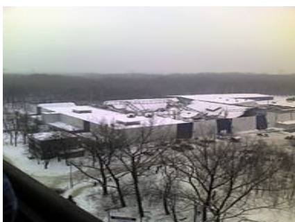
Katastrofa budowlana na śląsku

Nadmierna, nieprzemyślana zabudowa i jej widoczne negatywne skutki-bardzo często szybka budowa wielu budynków i konstrukcji może skończyć się zawaleniem czy też w niektórych przypadkach eksplozją.