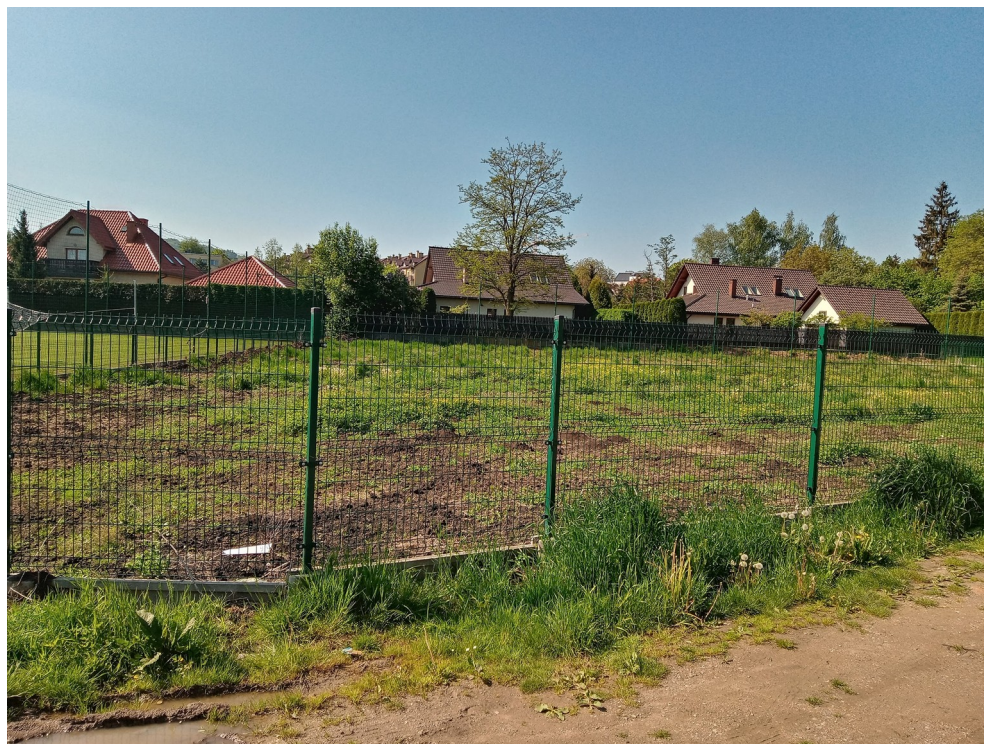
miejsce przed zmianą

Chciałbym aby powstało miejsce zbliżone do wykonanego przeze mnie. Takie, w którym miałyby co robić młodsze dzieci – dla nich jest plac zabaw (na samym końcu) na specjalnych płytkach (stąd kolor czerwony podłoża) i część pierwsza od wejścia (kolor zielony), która jest przeznaczona na odpoczynek dla wszystkich. Można tam zostawić rowery, jest tam trawa. Dzieci mogą biegać, bawić się w chowanego. Są miejsca do siedzenia czy leżakowania. Po prawej jest teren dla dzieciaków na deskorolkach (kolor zielony specjalne podłoża), rampa, nawet jakieś górki dla jeżdżących na rowerach. Dalej miejsce do grania w tenisa czy badmintona (brązowe podłoża) Koło placu zabaw znów teren zielony z trawą, małą bramką dla dzieci i miejsce na toalety (brąz) i do zabawy jakby lochy. Pomędzy placem zabaw a wspólną częścią byłaby przestrzeń dla ćwiczących (kolor różowy). Miejscem do powstania tego projektu byłby teren pomiędzy placem zabaw a boiskiem na Strzelców Wielickich (zdjęcie, można połączyć to z placem zabaw) lub teren za orlikiem a przed szeregówkami lub choć częściowo za boiskiem do koszykówki.