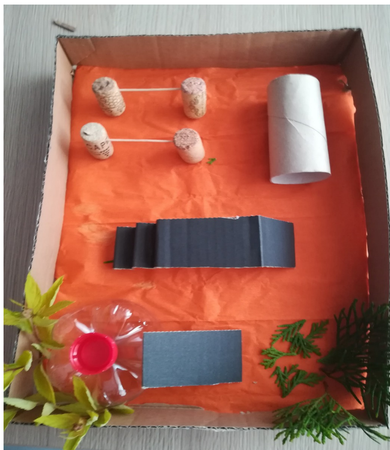
wybieg dla psów

Dookoła posadziłbym drzewa i krzewy, aby dawały tlen. Jako podłoże użyłbym przyjaznego dla łapek psów materiału.