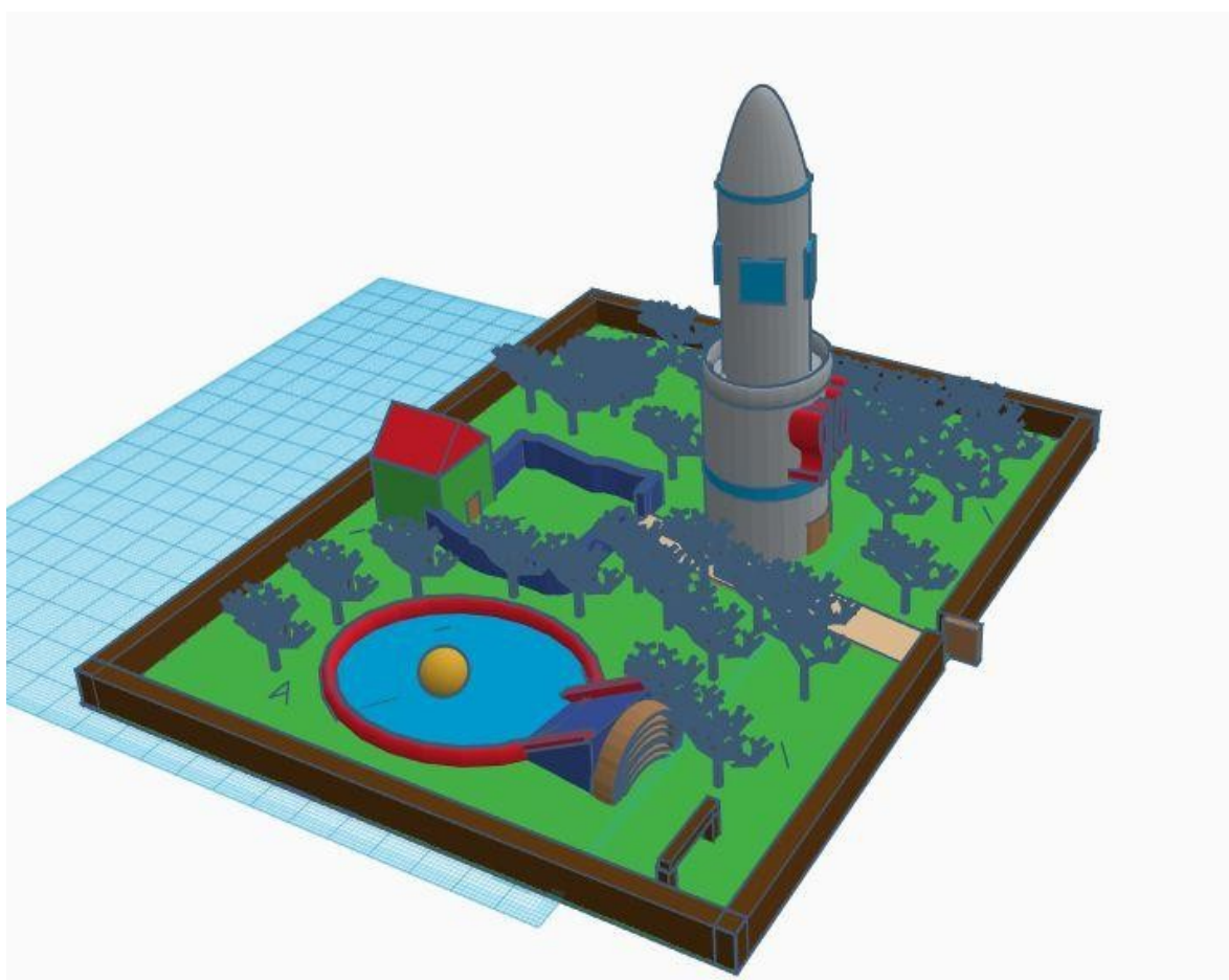
Park, a w nim schronisko dla psów